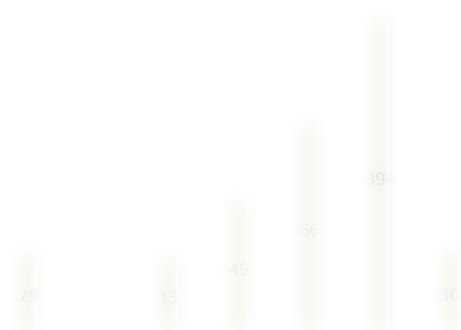
Диаграмма 28. Структура поставок ксантановых смол Halliburton по отраслям